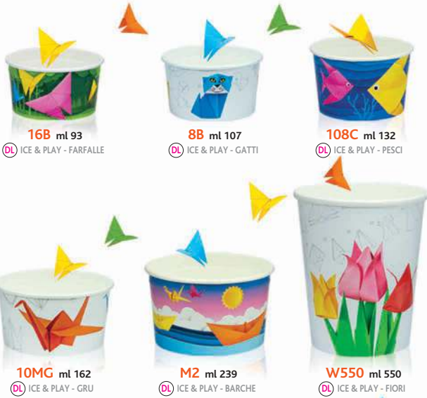
16B ml 93 DL ICE & PLAY - FARFALLE