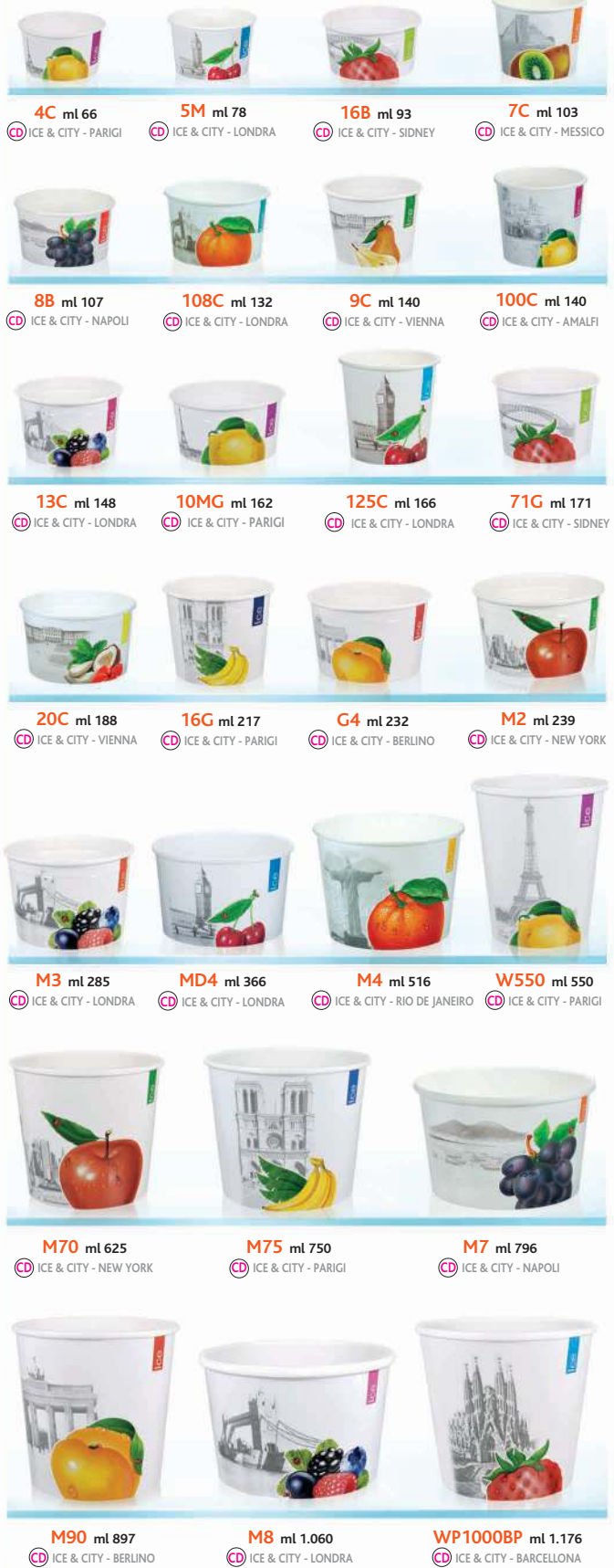
4C ml 66 CD ICE & CITY - PARIGI