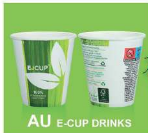
AU E-CUP DRINKS