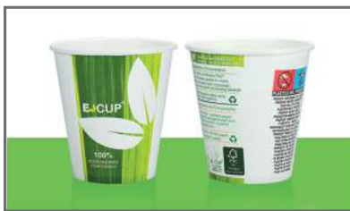
AU E-CUP DRINKS